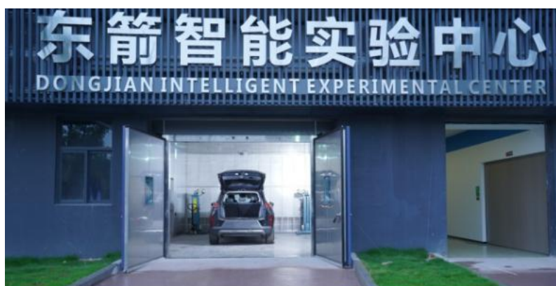
东箭智能实验中心